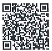
แบบตอบรับ