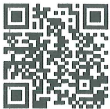
ลงทะเบียน

จึงเรียนมาเพื่อโปรดพิจารณาอนุมัติและสนับสนุน ให้ข้าราชการในสังกัดของท่านที่สนใจ เข้าร่วมประชุม และนำเสนอผลงาน ในวัน เวลา และสถานที่ดังกล่าวด้วย