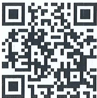
QR code ลงทะเบียน

จึงเรียนมาเพื่อโปรดให้ความอนุเคราะห์ประชาสัมพันธ์ ในหน่วยงานของท่าน ให้ทราบโดยทั่วกัน รวมทั้ง สนับสนุนบุคลากรที่สนใจเข้าร่วมโครงการในครั้งนี้ จักเป็นพระคุณอย่างยิ่ง