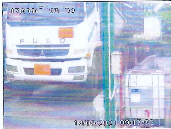
เตาเผาขยะอุตสาหกรรม บริษัท อัคคีปราการ จำกัด (มหาชน)