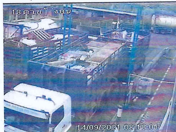
เตาเผาขยะอุตสาหกรรม บริษัท อัคคีปราการ จำกัด (มหาชน)