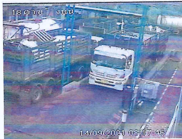
เตาเผาขยะอุตสาหกรรม บริษัท อัคคีปราการ จำกัด (มหาชน)