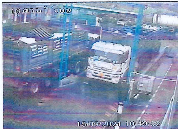
เตาเผาขยะอุตสาหกรรม บริษัท อัคคีปราการ จำกัด (มหาชน)