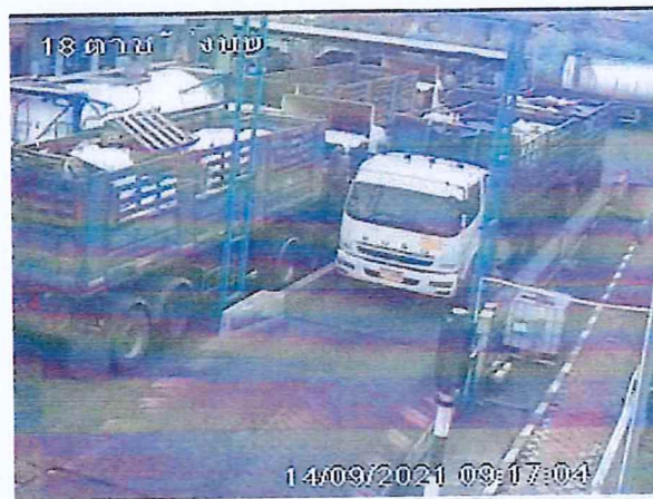
เตาเผาขยะอุตสาหกรรม บริษัท อัคคีปราการ จำกัด (มหาชน)