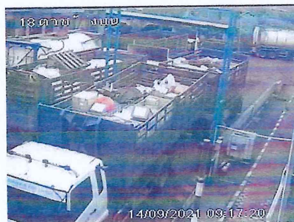
เตาเผาขยะอุตสาหกรรม บริษัท อัคคีปราการ จำกัด (มหาชน)