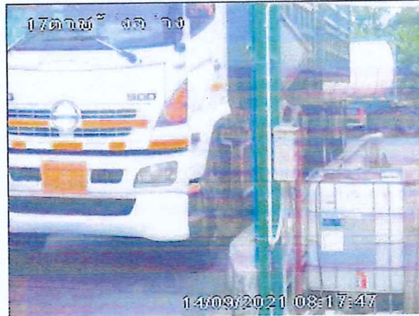
เตาเผาขยะอุตสาหกรรม บริษัท อัคคีปราการ จำกัด (มหาชน)