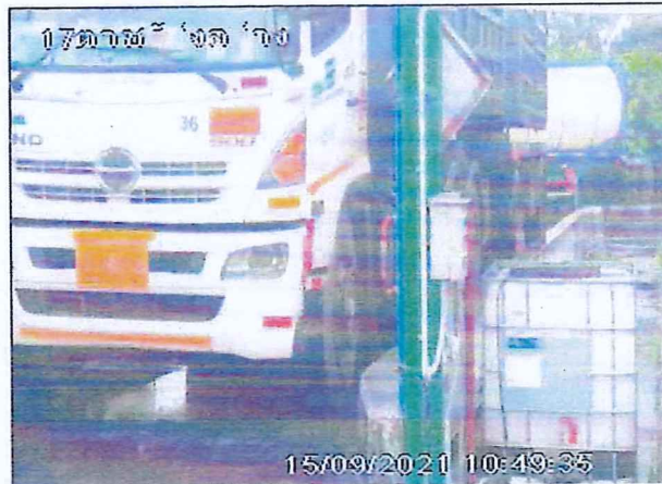
เตาเผาขยะอุตสาหกรรม บริษัท อัคคีปราการ จำกัด (มหาชน)