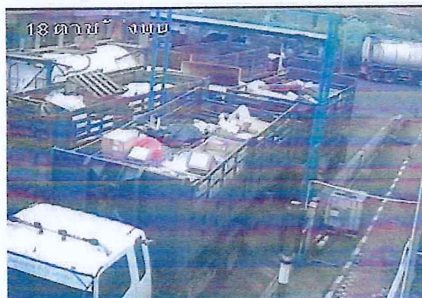
เตาเผาขยะอุตสาหกรรม บริษัท อัคคีปราการ จำกัด (มหาชน)